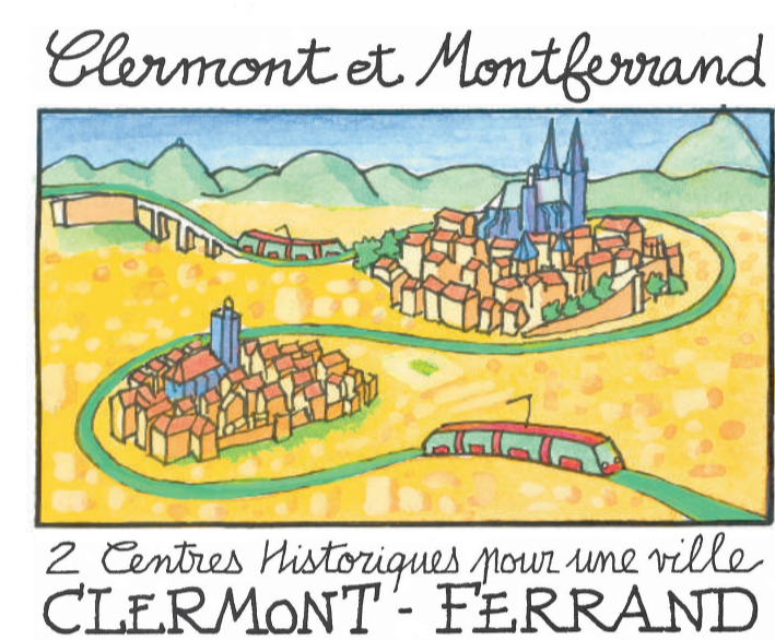
2 Centres historiques pour une ville CLERMONT-FERRAND